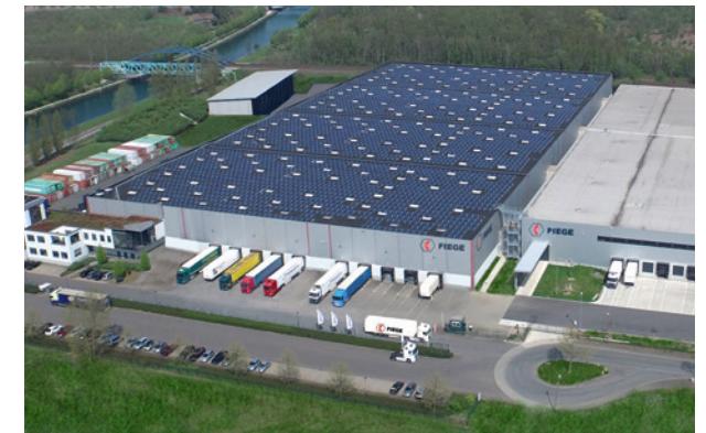
Solarpark Dortmund – Anlageobjekt Zukunftsenergie Deutschland 4

Diesen Weg werden wir mit unseren aktuellen Angeboten konsequent fortsetzen.