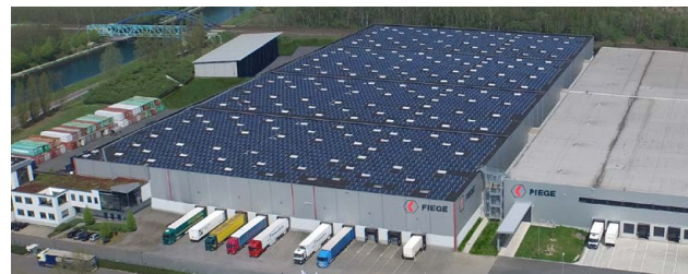
Solarpark Dortmund – Anlageobjekt Zukunftsenergie Deutschland 4